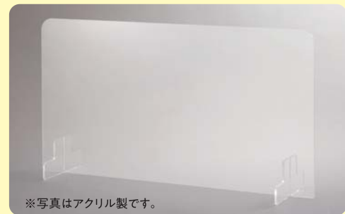
※写真はアクリル製です。